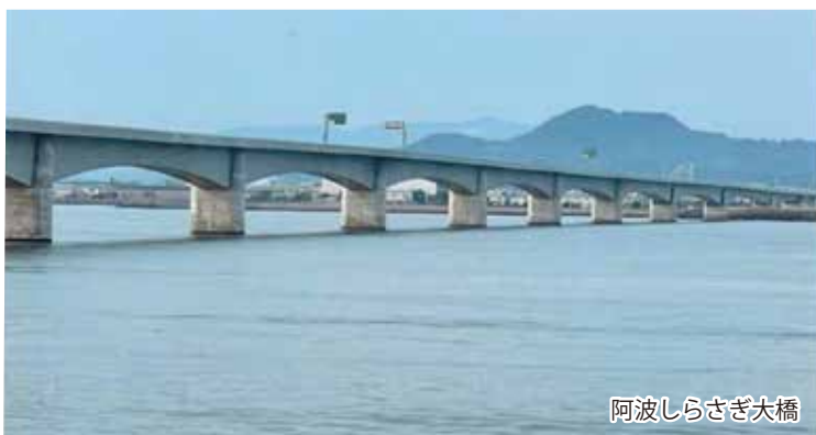
阿波しらさぎ大橋

特産品として蓮根、さつまいも、カリフラワー等があげられます。また、徳島県立阿波十郎兵衛屋敷では伝統の人形浄瑠璃を上演しています。阿波人形浄瑠璃平成座が太夫・三味線・人形遣いを抱え、後進の育成をしながら県内外で活躍しています。