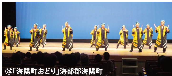
⑥「海陽町おどり」海部郡海陽町