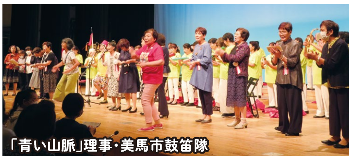
「青い山脈」理事・美馬市鼓笛隊