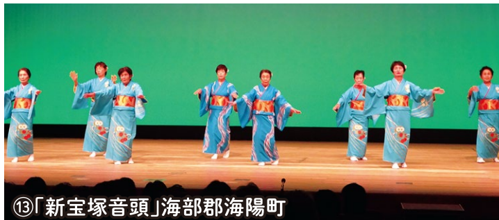
⑬「新宝塚音頭」海部郡海陽町