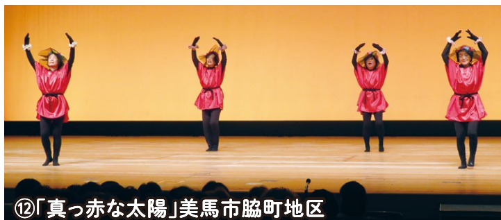
⑫「真っ赤な太陽」美馬市脇町地区