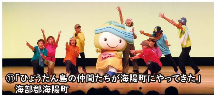
⑪「ひょうたん島の仲間たちが海陽町にやってきた」 海部郡海陽町