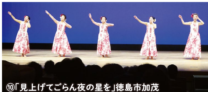
⑩「見上げてごらん夜の星を」徳島市加茂