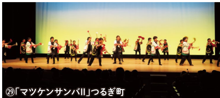
⑨「マツケンサンバII」つるぎ町