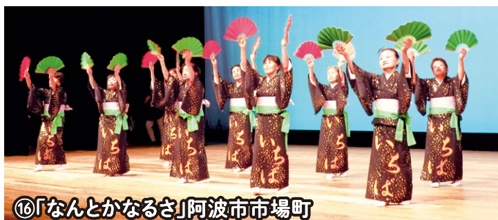
⑯「なんとかなるさ」阿波市市場町