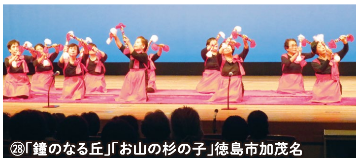
⑧「鐘のなる丘」「お山の杉の子」徳島市加茂名