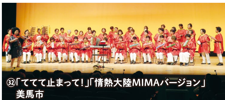
⑫「ててて止まって!」「情熱大陸MIMAバージョン」美馬市