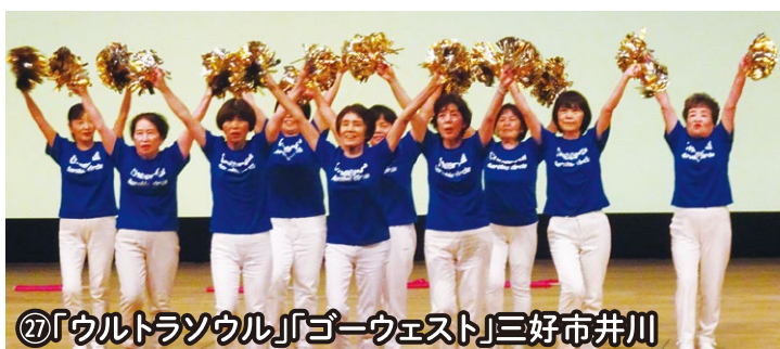
⑦「ウルトラソウル」「ゴーウェスト」三好市井川