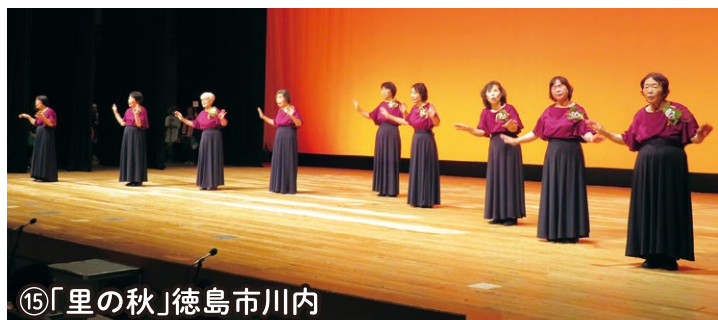
⑮「里の秋」徳島市川内