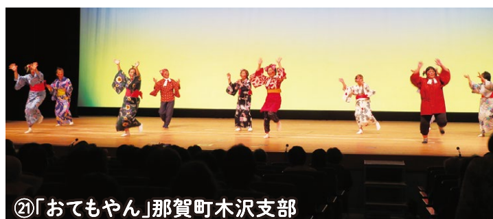
㉑「おてもやん」那賀町木沢支部