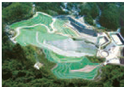
明和クリーン管理型処分場