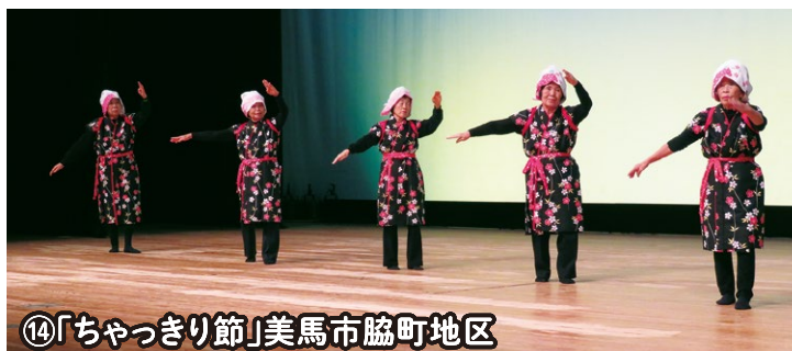
⑭「ちゃっきり節」美馬市脇町地区