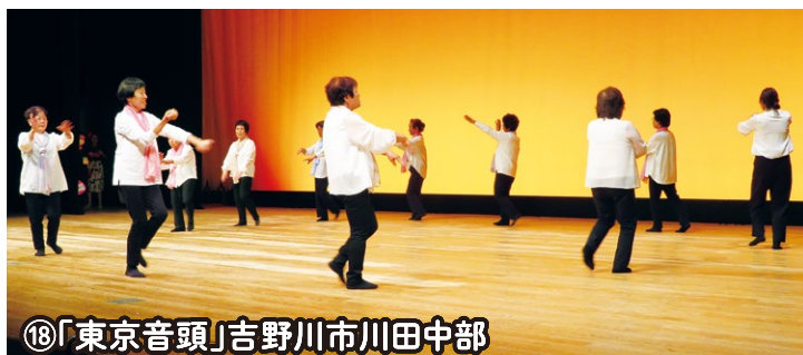
⑱「東京音頭」吉野川市川田中部