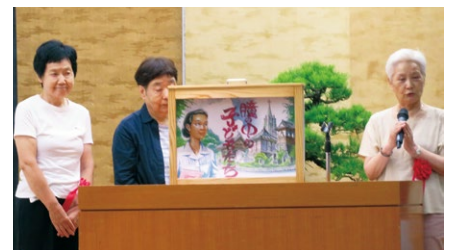
徳島市遺族連合会副会長兼女性部の方々