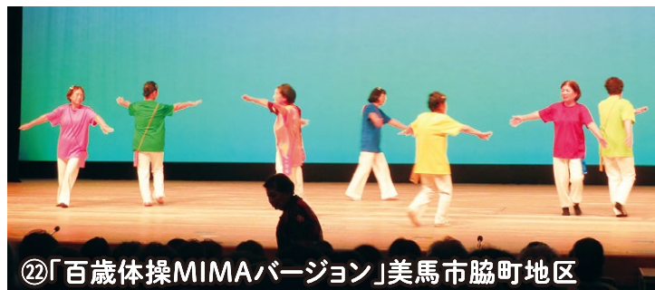
②「百歳体操MIMAバージョン」美馬市脇町地区