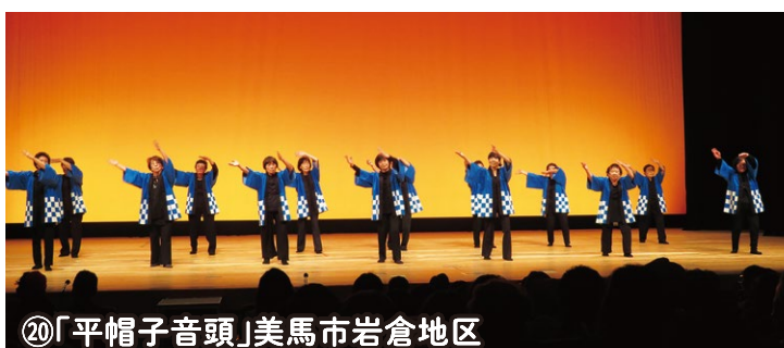
⑳「平帽子音頭」美馬市岩倉地区