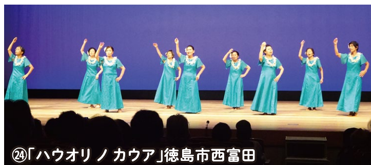
④「ハウオリノカウア」徳島市西富田