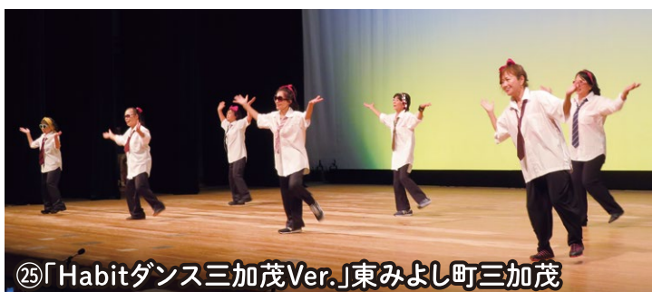
⑤「Habitダンス三加茂Ver.」東みよし町三加茂