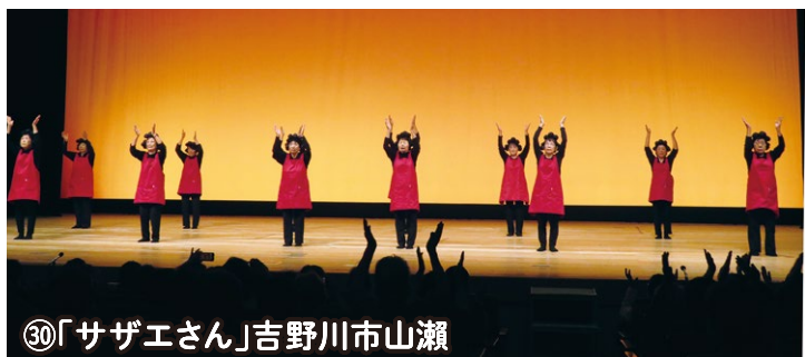
⑩「サザエさん」吉野川市山瀬