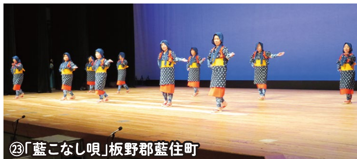
③「藍こなし唄」板野郡藍住町