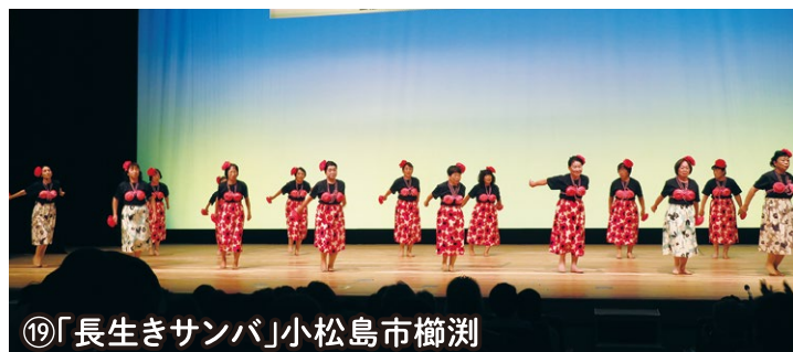
⑲「長生きサンバ」小松島市櫛渚